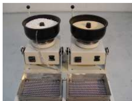
Minor XS 6 PROL K2 WD