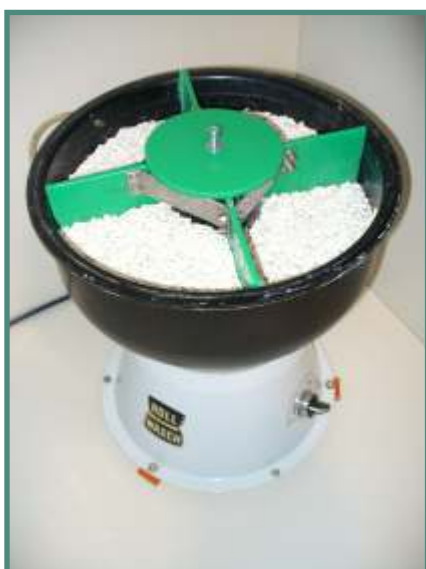
Minor XS 6 + Splitter 4 XS6