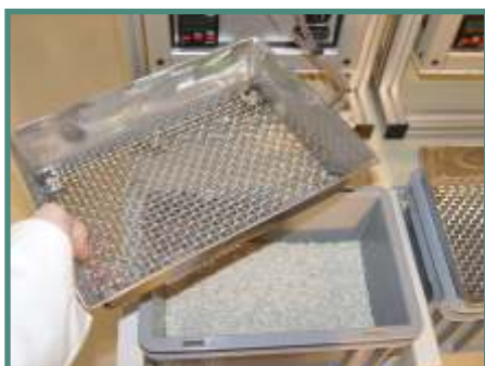
Minor XS 6 PRO K2 WD