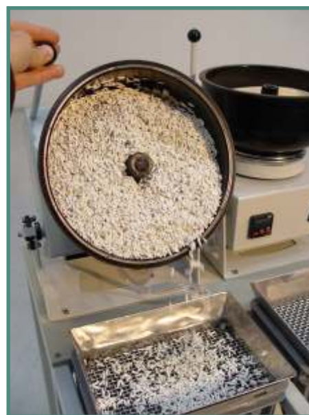
Minor XS 6 PROL K2 WD

La serie Minor XS PRO K2 / K3 rappresenta l'evoluzione del progetto Minor XS PRO, con la possibilità di unire più macchine, anche di tipo "MINI-MAG", in una stazione di lavoro razionale.