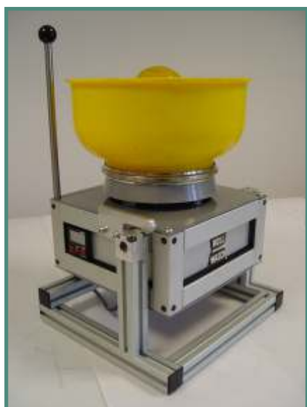
Minor XS 6 PRO