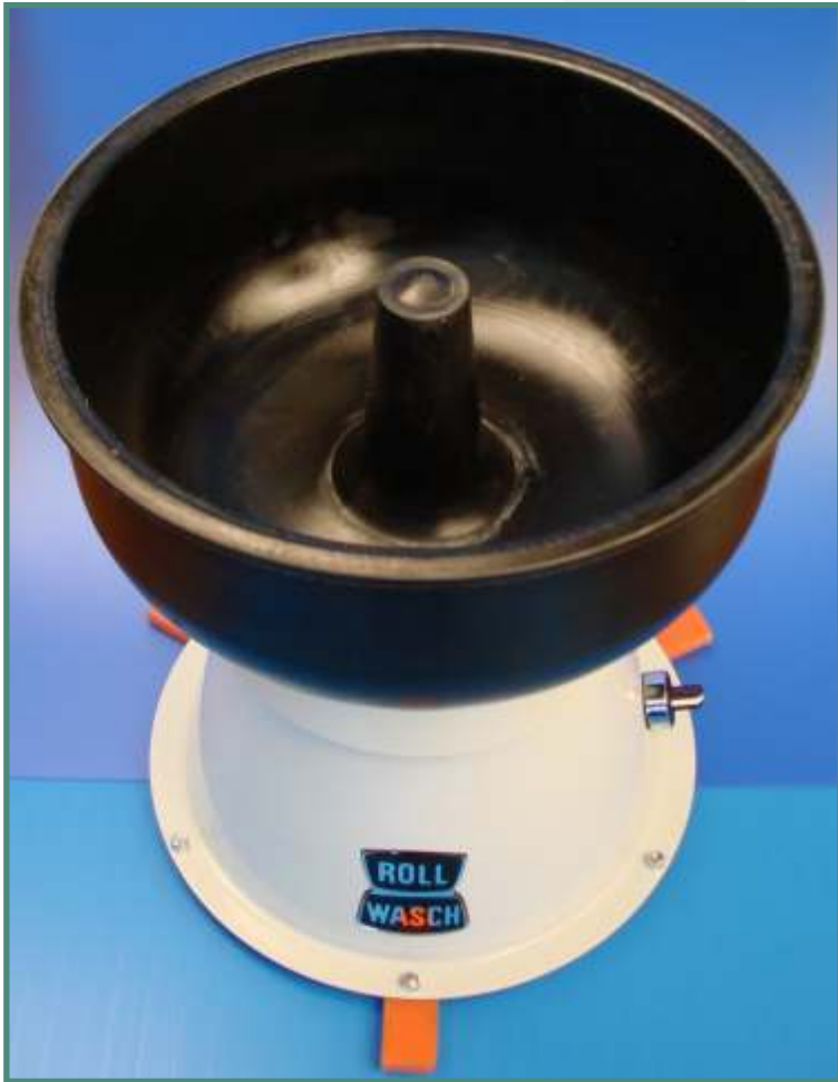
Minor XS 6 GM con cilindro centrale fisso Minor XS 6 GM with fixed central cylinder