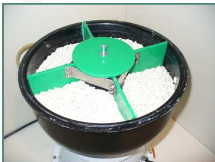
Minor XS 6 + Splitter 4 XS6

La serie Minor XS offre la possibilità di avvicinarsi al mondo della vibrofinitura in modo semplice e pratico.