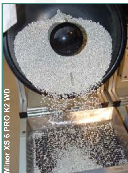
Minor XS 6 PRO K2 WD