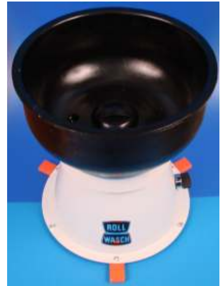
Minor XS 6 XT senza cilindro centrale Minor XS 6 XT without central cylinder