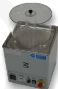
Mini Mag 15 V GM