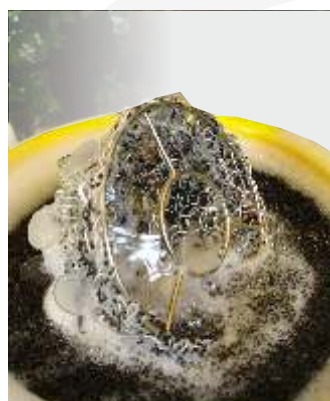
few examples, by Rollwasch®