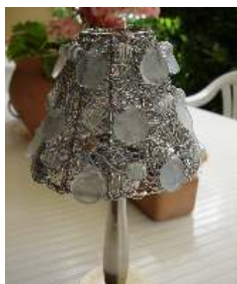
alcuni esempi, by Rollwasch®