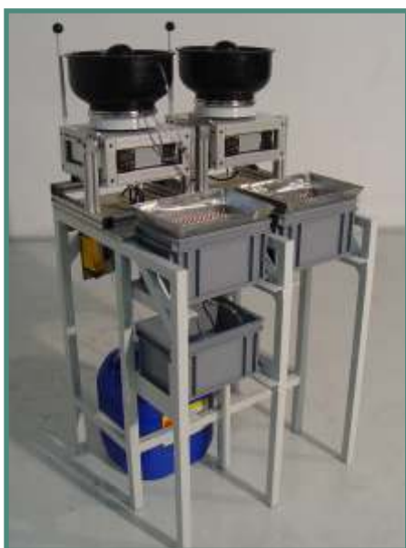
Minor XS 6 PRO K2 WD