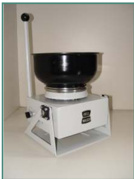
Minor XS 6 GM PROL